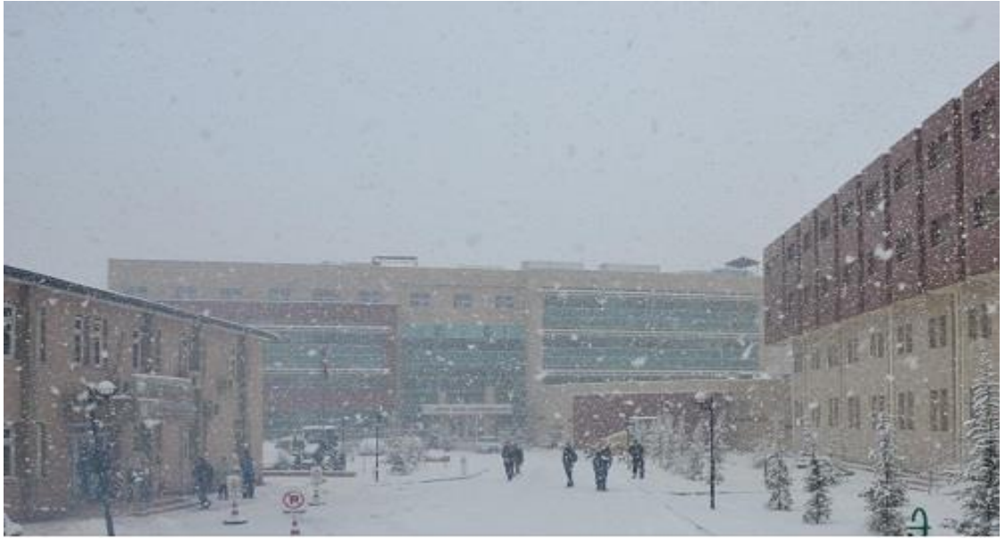
(Şekil 1): Sağlık Hizmetleri Meslek Yüksekokulunun yeni binası