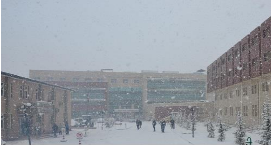
(Şekil 1): Sağlık Hizmetleri Meslek Yüksekokulunun yeni binası